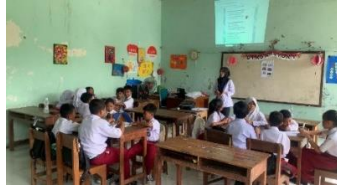
Gambar 2. Proses Pembelajaran (Diskusi Kelompok)

Berikut ini adalah dokumentasi peneliti saat observasi siswa di SD kelas.IV SD Negeri Bugangan 02 Semarang pada saat pelaksanaan pembelajaran.