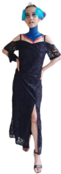
Gambar 6: Hasil Akhir Adaptasi Warna Bulu Burung Kasuari.

Model busana ini secara keseluruhan memiliki siluet I dengan ciri pada bagian atas hingga bawah nampak lurus sehingga terkesan memiliki siluet bayangan seperti huruf I. Busana ini merupakan slit dress dengan ciri khas bukaan pada bagian muka sebelah kanan dress dari bawah hingga atas lutut tanpa terhubung ke bagian pinggang, bukaan tersebut memunculkan kesan balance pada busana. Dress ini menggunakan material kain satin maxmara dengan brocade berwarna hitam yang diadaptasi dari warna bulu tubuh burung kasuari.