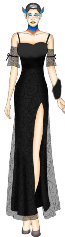
Gambar 4: Desain Busana.