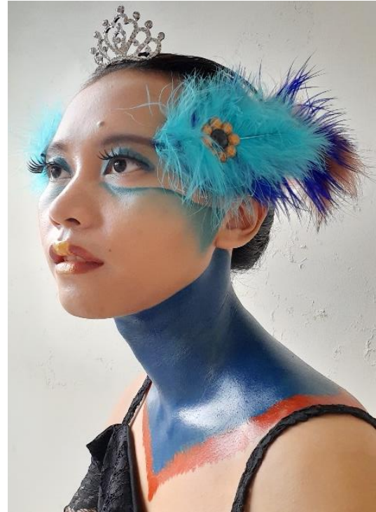
Gambar 7: Hasil Akhir Adaptasi Warna Kepala Burung Kasuari.

kontras warna kepala dan badan pada bulu burung kasuari. Secara keseluruhan busana ini memiliki style exotic dramatic dengan bertemakan The Color of Cassowary .