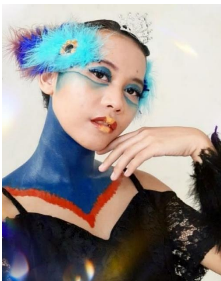
Gambar 5: Hasil Akhir Makeup .

Adapun analisis unsur visual pada makeup fantasi mixed media , yaitu: