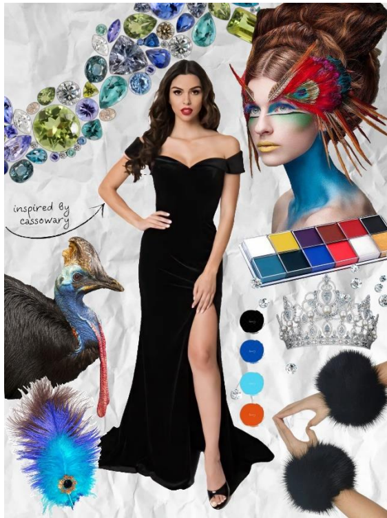
Gambar 2: Moodboard.