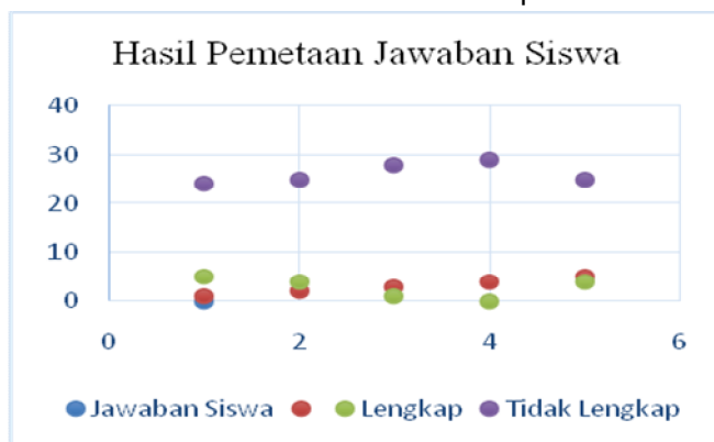
Gambar Hasil Tes Pemetaan Jawaban Siswa

Dari gambar di atas dapat diketahui bahwa nilai tertinggi yang diperoleh siswa adalah 71 dan nilai terendah yang diperoleh adalah 8. Dari hasil tes uraian menunjukkan bahwa sebagian besar siswa masih kesulitan dalam menyelesaikan masalah matematis. Berikut diagram pemetaan hasil tes uraian siswa dalam pemecahan masalah: