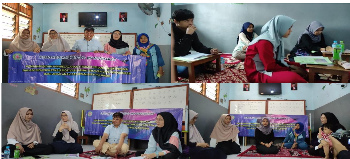
Gambar 2. Kegiatan bimbingan belajar di PKBM Inovatif Cibinong

Hasil dari kegiatan pengabdian ini berupa pendampingan siswa melalui kegiatan bimbingan pembelajaran dengan materi Akuntansi dan Keuangan serta pemberian motivasi berupa pembekalan terkait memasuki dunia kerja dan dunia kampus yang dilaksanakan di PKBM Inovatif Cibinong. Kegiatan pengabdian ini merupakan salah satu program pengabdian masyarakat bagi dosen sebagai upaya pelaksanaan tri dharma perguruan tinggi. Kegiatan pengabdian kepada masyarakat ini memberikan banyak manfaat, wawasan dan pengetahuan kepada anak-anak di PKBM Inovatif Cibinong, terutama dalam meningkatkan pemahaman laporan keuangan dan motivasi belajar. Pelaksanaan kegiatan bimbingan belajar ini menggunakan 5 tahapan, yaitu: (1) Pemaparan materi mengenai akuntansi dan keuangan, (2) Ice Breaking (3) tanya jawab, (4) Permainan berupa kuis yang menarik, pemotivasian siswa dalam belajar melalui motivasi berorientasi materi (5) motivasi tentang kehidupan berupa pembekalan ketika nanti memasuki dunia kerja dan dunia kampus, (6) pemberian reward (hadiah) berupa pujian/penghargaan secara lisan dan berupa barang.