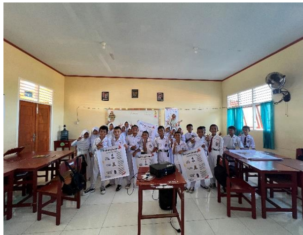
Gambar 4. Peserta Kegiatan Pengenalan Cagar Budaya Kota Ternate pada siswa SDN 50 Kota Ternate

Kegiatan sosialisasi dilanjutkan dengan penyerahan poster kepada pihak sekolah. Poster yang ditampilkan dalam sosialisasi diserahkan kepada pihak sekolah agar dapat di tempel di kelas-kelas. Dengan demikian siswa akan lebih mudah mengingat para pahlawan nasional dari Maluku Utara.