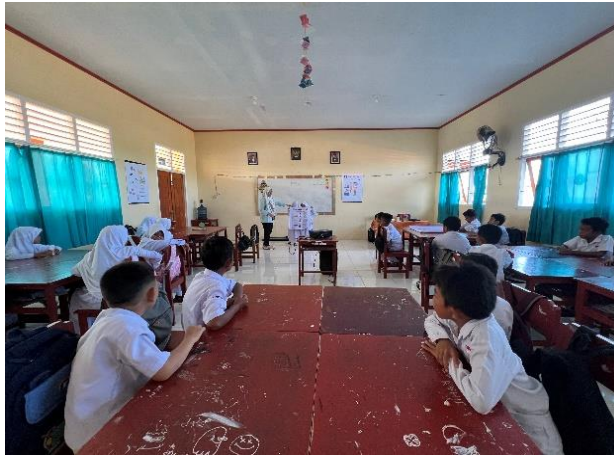
Gambar 3. Kegiatan Pengenalan Cagar Budaya Kota Ternate pada siswa SDN 50 Kota Ternate

Pengenalan pahlawan nasional dari Maluku Utara disampaikan dengan metode ceramah interaktif dibantu dengan media poster. Para siswa diajak untuk menceritakan tokoh yang mereka kenali dan menceritakan kisah yang mereka ketahui tentang tokoh tersebut.