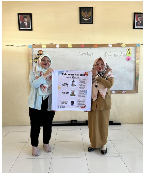
Gambar 5. Penyerahan poster Cagar Budaya Kota Ternate kepada SDN 50 Kota Ternate