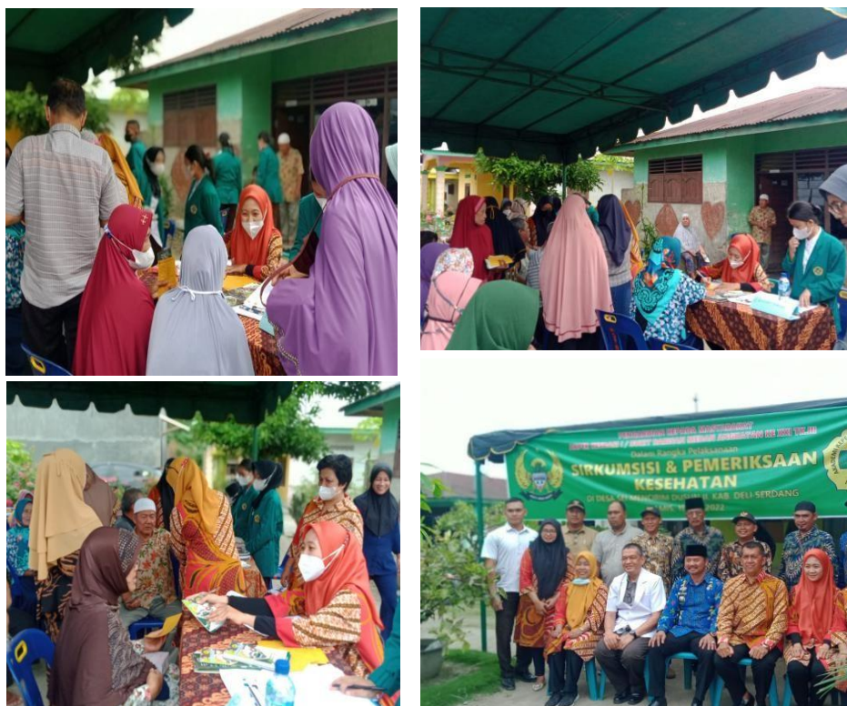
Gambar 1. Edukasi dan pemeriksaan KGD

Kegiatan pengabdian dilakukan di Aula Desa Sei Mencirim, Kecamatan Dusun II Kabupaten Deli Serdang tanggal 17 Juni 2023. Peserta pengabdian ini diikuti oleh warga desa yang berjumlah 50 orang dengan metode berupa penyuluhan kesehatan dan pemeriksaan glukosa darah sewaktu menggunakan alat easy touch secara gratis. Rentang Umur peserta dari 40 tahun hingga 70 tahun.