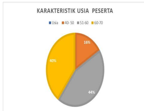
Gambar 2. Karakteristik Usia

Berdasarkan data diagram peserta kegiatan Pengabdian di dapatkan Karakteristik rata - rata Usia peserta adalah 16 % berusia 40-50, 44% peserta berusia 51-60 orang dan 40 % berusia 61-70. Menurut penelitian mirna (2020) tentang analisis tentang analisis determinan penyakit DM Tipe II pada usia produktif di Kecamatan Lengayang pesisir selatan faktor usia mempengaruhi penurunan pada semua sistem tubuh, tidak terkecuali sistem endokrin. Penambahan usia menyebabkan kondisi resistensi pada insulin yang berakibat tidak stabilnya level gula darah sehingga banyaknya kejadian DM salah satu diantaranya adalah karena faktor penambahan usia yang secara degenerative menyebabkan penurunan fungsi tubuh. Jika sehingga semakin meningkatnya umur seseorang maka semakin besar kejadian DM