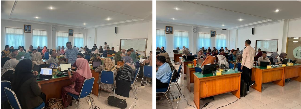
Gambar 1. Paparan Materi dan Pendampingan

Pada materi kedua ini pemateri menyampaikan perlu adanya revitalisasi kurikulum untuk menyesuaikan Permendikbudristek no. 53 tahun 2023, meliputi penyusunan CPL dan struktur kurikulum. Berdasarkan panduan penyusunan kurikulum pendidikan tinggi CPL tidak seperti pada Permendikbud No. 3 Tahun 2020, dimana rumusan CPL meliputi aspek pengetahuan, sikap, keterampilan umum dan khusus. Tim pengembang kurikulum dapat menyusun CPL terintegrasi. Rumusan CPL Rumusan CPL disarankan untuk memuat kemampuan yang diperlukan dalam era industri 4.0 menuju masyarakat 5.0 dan keterampilan abad 21 di antaranya kemampuan tentang literasi data, literasi teknologi, literasi manusia, keterampilan abad 21 (4C) (Kusumawardani et al., 2024). Beberapa CPL (Tabel 2) dan peta kurikulum (Gambar 2) yang disusun oleh tim kurikulum program studi.